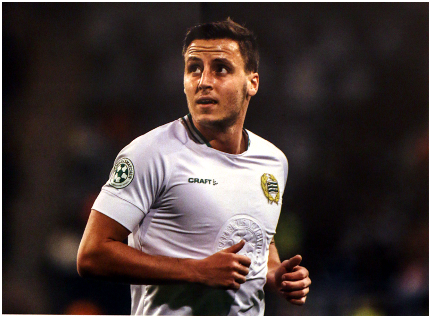
Cupmatchen mot Dalkurd 4/3 2019.

spela på. Det var en tuff match med mycket du- eller och vi ska nog vara ganska nöjda med en poäng. Jag tycker det var rättvist.