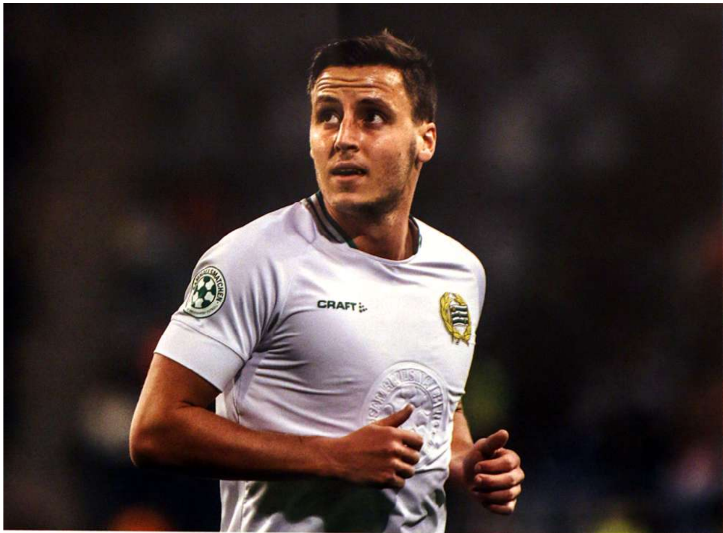
Cupmatchen mot Dalkurd 4/3 2019.

spela på. Det var en tuff match med mycket du- eller och vi ska nog vara ganska nöjda med en poäng. Jag tycker det var rättvist.