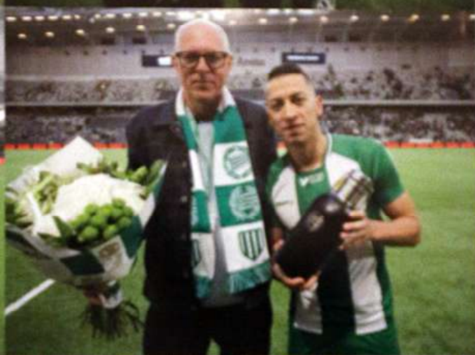
Matchen lirare mot Kalmar FF 7/4, Djurgårdens IF 28/4 och Östersunds FK 14/5.