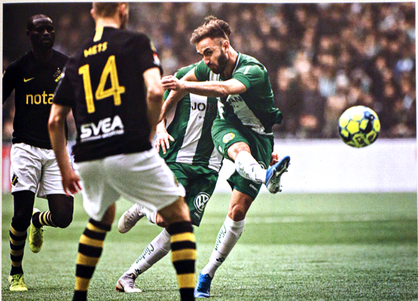
"Mujo" bäst i Allsvenskan? Här i mötet mot AIK, 22/9.